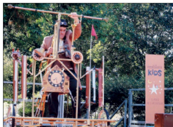
Immagini della passata edizione di Rovigoracconta Kids

Dopo il successo della prima edizione, a Rovigoracconta Kids si conferma la presenza degli amatissimi giochi in legno che l'anno scorso hanno ap-