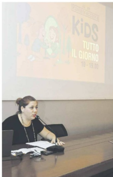
LA PRESENTAZIONE Del festival di libri per ragazzi RovigoraccontaKids