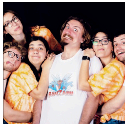
Il gruppo Banzai

E ora anche il vostro "piccolo grande libro dei giochi".